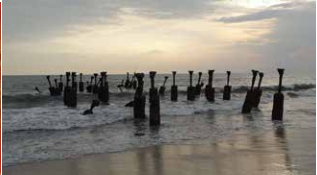
1572-ൽ കോഴിക്കോട് തുറമുഖം